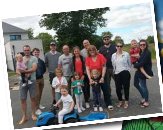
Lotissement « Le Clos Moriaux »