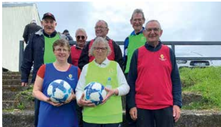
Notre groupe lors du rassemblement du 6 Mai à Médréac