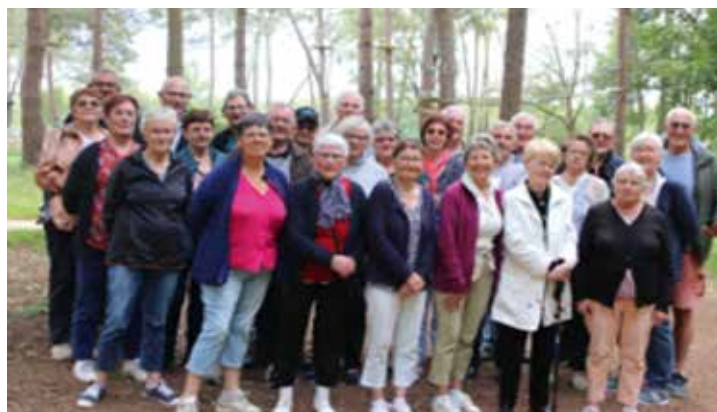
Pique-nique à Trémelin le 4 Juin