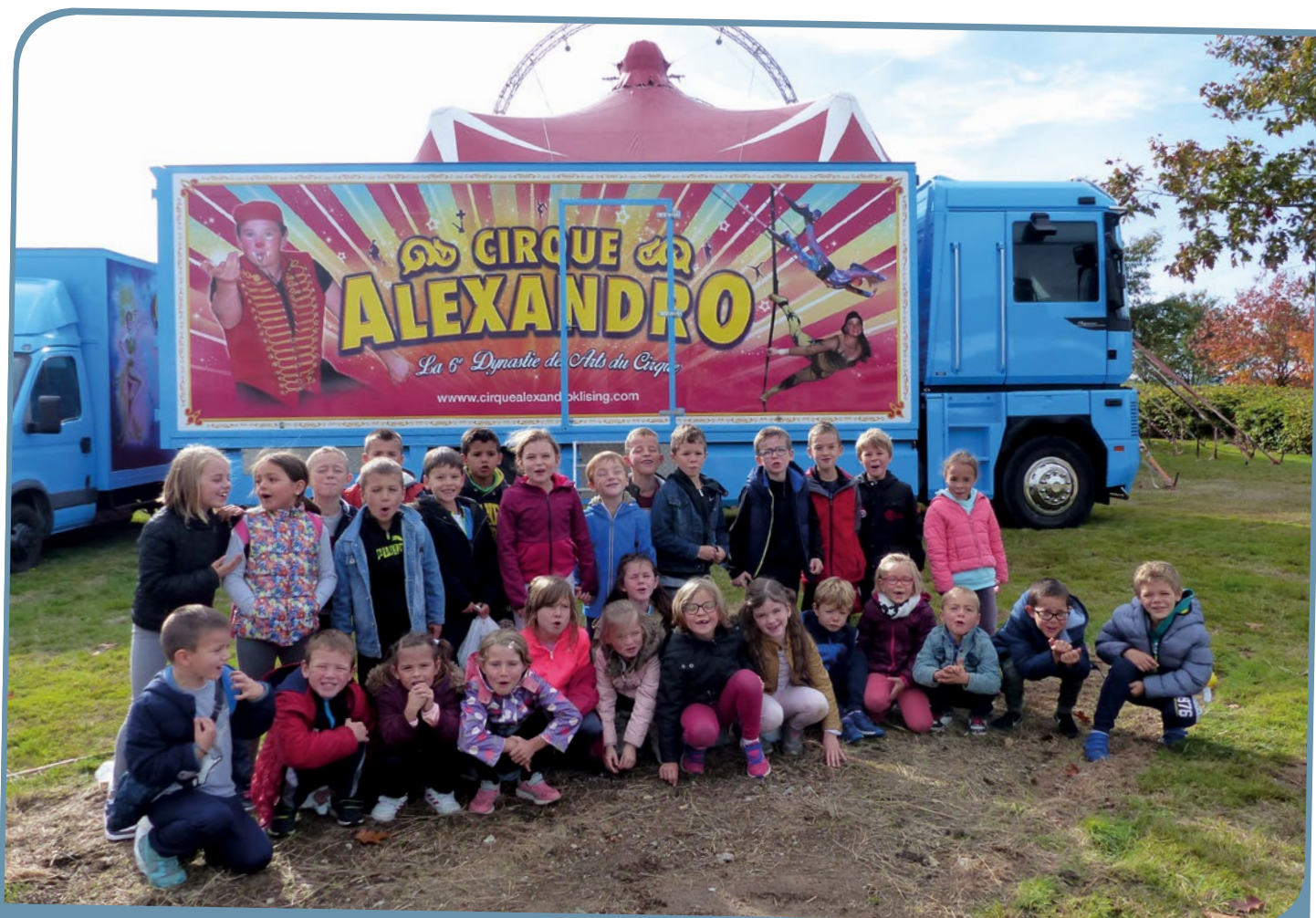
Représentation avec le cirque Alexandro, à Landujan.