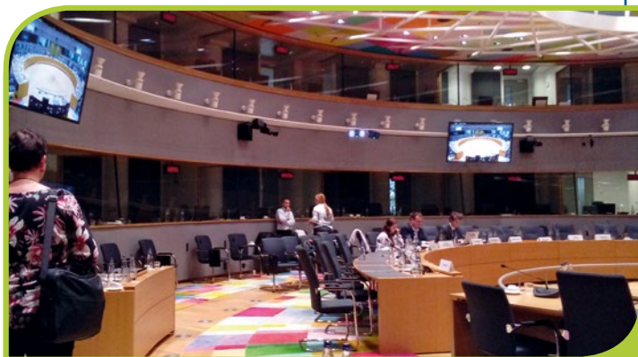
La salle du Conseil.

Le COREPER 2, composé des ambassadeurs, traite de sujets à caractère politique, commercial, économique ou institutionnel.