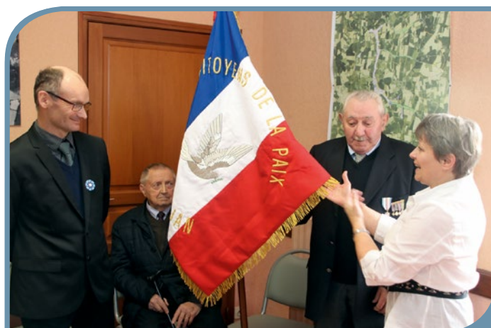
Mme le maire remet le nouveau drapeau.

La journée s'est poursuivie par un vin d'honneur offert par la municipalité, puis un repas à la salle des fêtes.