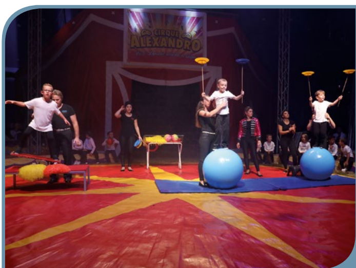
Répétitions avec le cirque Alexandro, à Landujan.

Nous remercions tous les parents d'élèves pour leur confiance. Toute l'équipe pédagogique vous souhaite une très belle année 2019 .