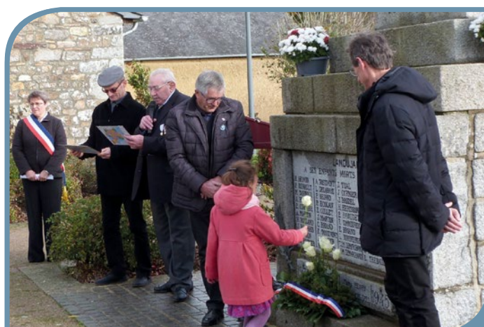
50 roses ont été déposées par les enfants devant le monument.