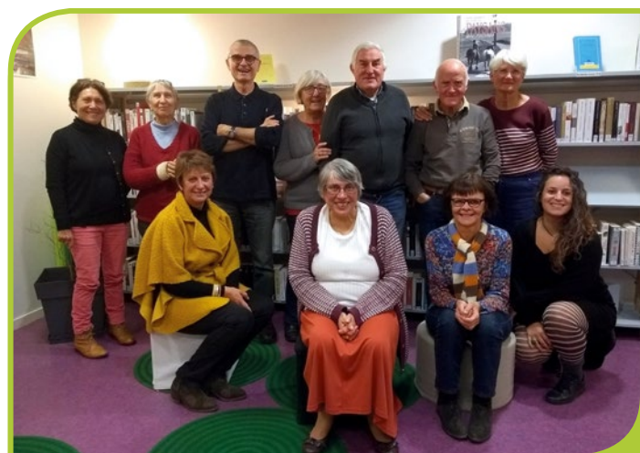
Le carré des poètes retrouvés.

Pour ce faire, nous vous donnons donc rendez-vous le 18 mai pour une déambulation en mots et en musique en notre compagnie.