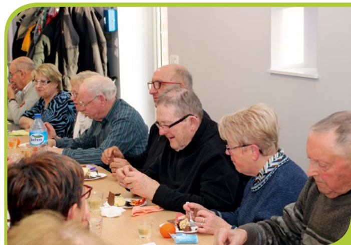
La bûche de Noël du Club.