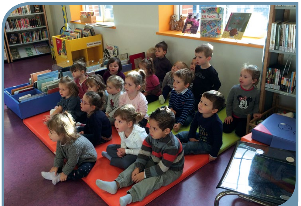
La classe des TPS-PS à la médiathèque de Landujan.