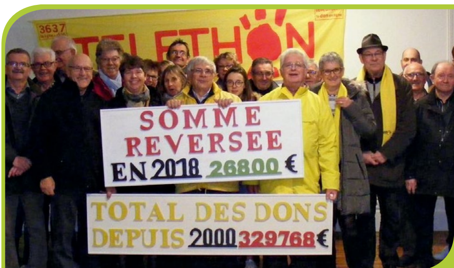
Résultat du Téléthon du Canton dévoilé à Médréac.

Les nombreuses manifestations, ainsi que la générosité des entreprises, artisans, commerçants, associations, partenaires, sans oublier celle des particuliers, ont permis d'atteindre ce montant, le meilleur depuis l'an 2000.