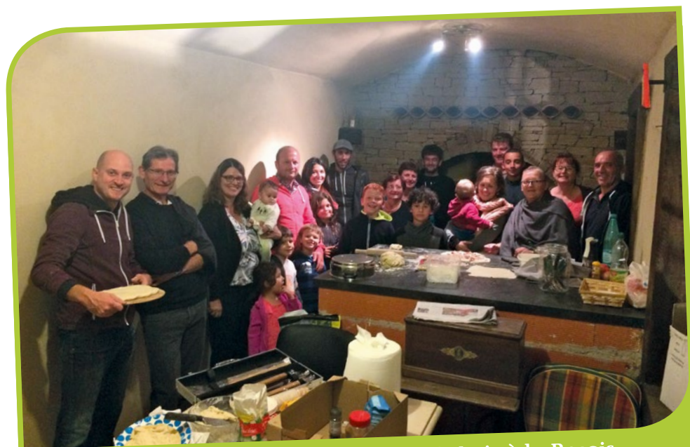
Soirée flammekueches et pizzas au feu de bois à la Rosais début septembre.

Pour 2019, le flambeau a été transmis aux communes de Boisgervilly et Saint-Uniac, locomotives de la prochaine édition les 6, 7 et 8 décembre 2019.