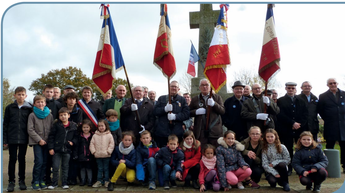
Devant le monument sont réunis les CATM, les citoyens de la Paix et les enfants ayant participé à la cérémonie.